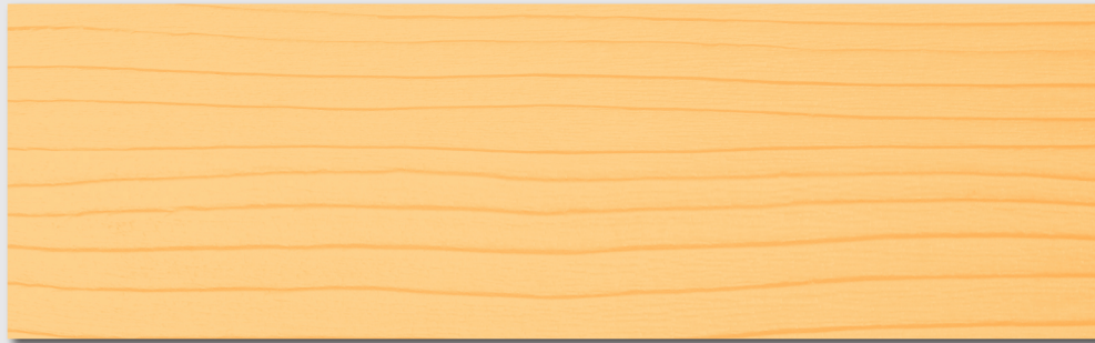
TL101 LARICE (cod. tintometro TL441)