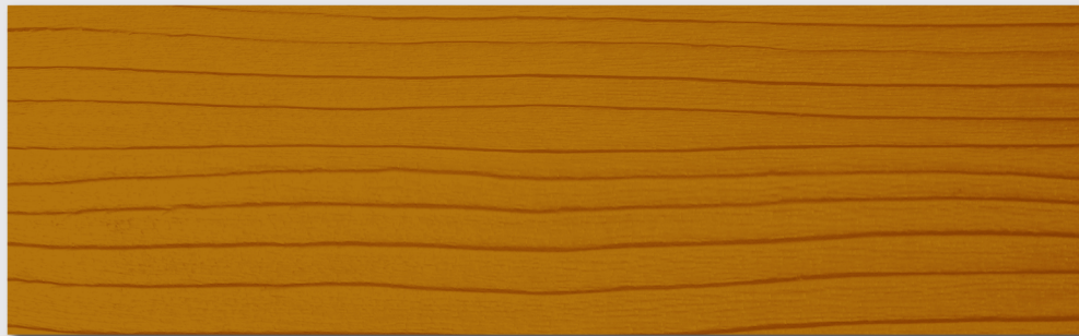
TL102 PINO (cod. tintometro TL442)