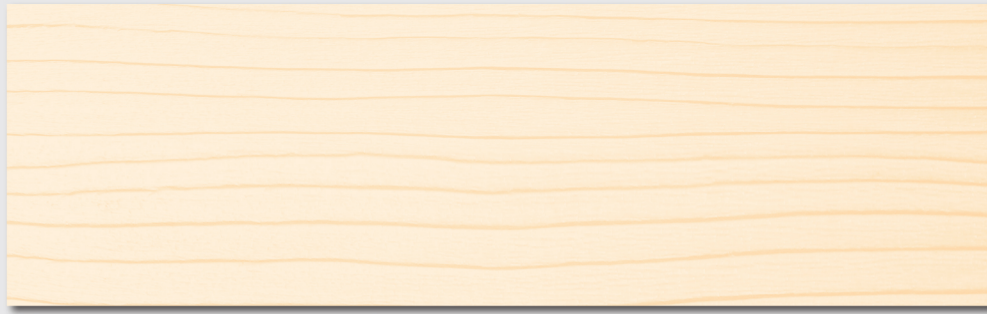
TL499 BIANCO (cod. tintometro TL411)