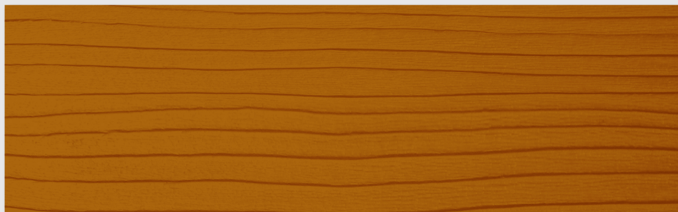
TL111 NOCE (cod. tintometro TL443)