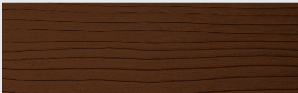
TL113 NOCE SCURO (cod. tintometro TL445)